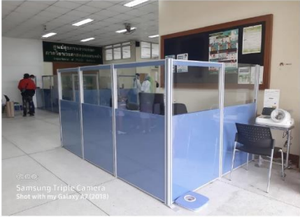
ภาพตัวอย่าง