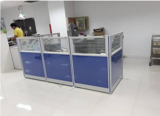
ภาพตัวอย่าง