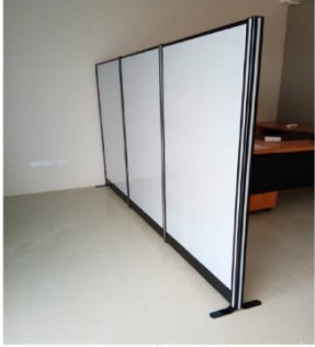
ภาพตัวอย่าง