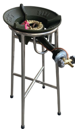
ชุดเตากลม สเตนเลส 2,290.-