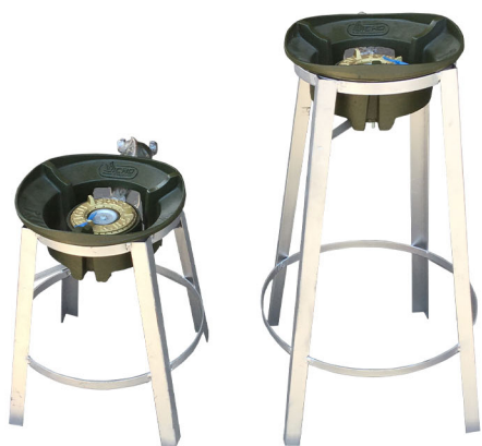
ชุดเตากลมเตี้ย 1,290.-