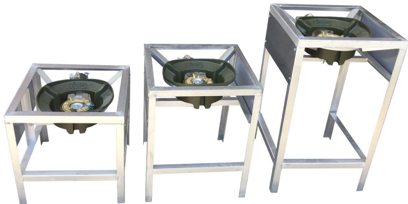
ชุดเตาขนาดเล็ก 1,390.-