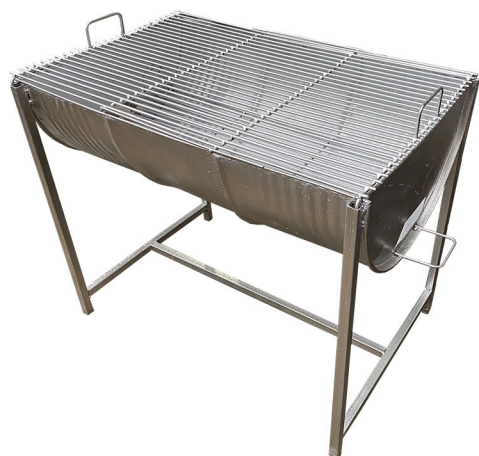
เตาย่างจัมโบ้ ดัวเงิน ขนาด 90x62x77 ซม. 2,090.-